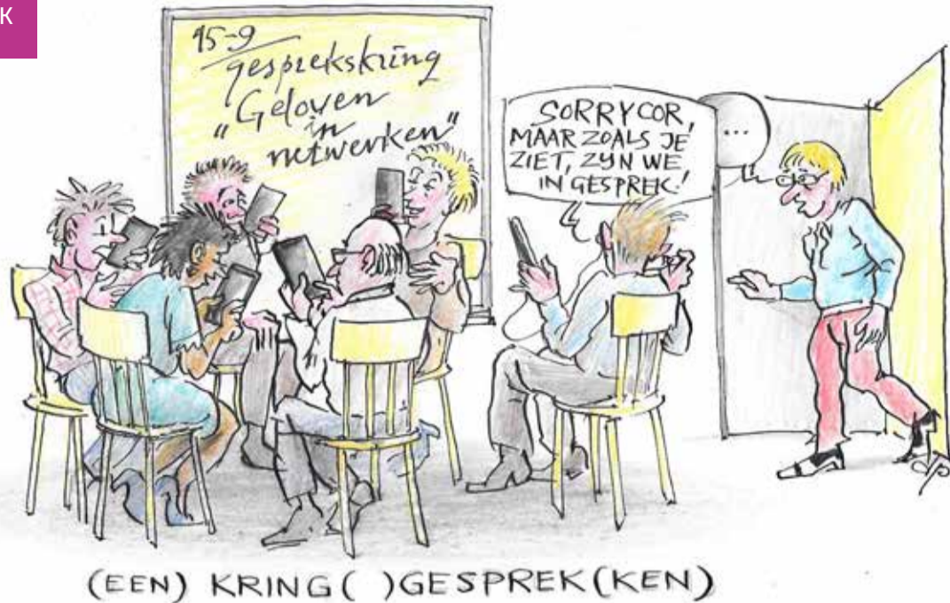
(EEN) KRING ( )GESPREK(KEN)